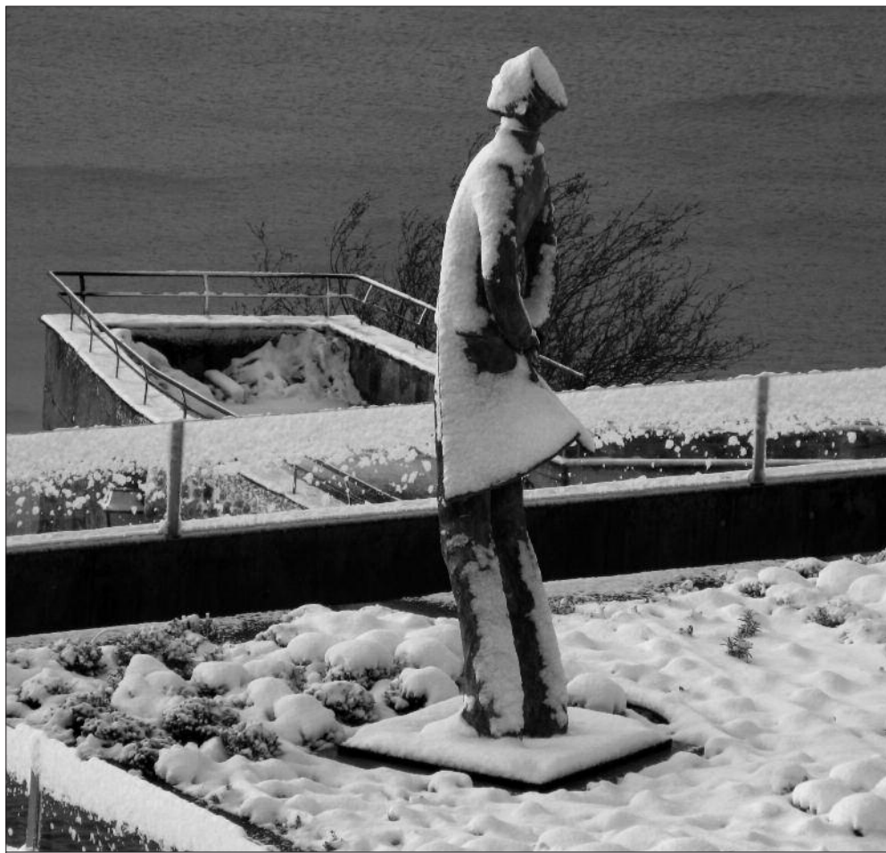
Corto Maltese sous la neige le 3 mars 2008.