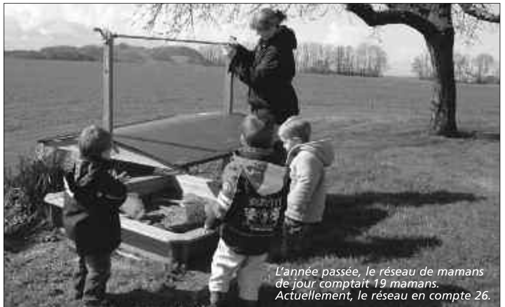
L'année passée, le réseau de mamans de jour comptait 19 mamans. Actuellement, le réseau en compte 26.

Exposé dès 19h30, puis repas composé de ce que chacun amène