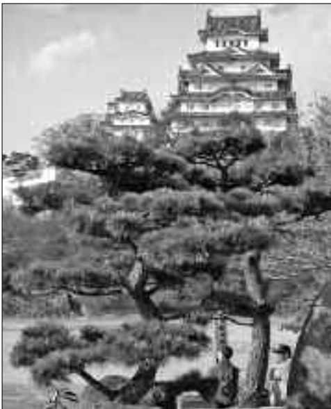
Le Château de Himegi.

Le 24 mars 2008, la Municipalité s'envole de Genève via Frankfort pour Osaka. Le 25 mars, visite de Hiroshima et de Mizojima, puis du Château de Himegi. Le 27 mars, visite de la ville de Nara, et dès le 28 mars celle de Kyoto et ses nombreux temples. Le 30 mars, visite de Nikko, station touristique à 1300 mètres d'altitude avec, le 31 mars au matin, de la neige de printemps. Puis en route pour Tokyo. Le 2 avril, visite de Nagara Furusato Mura proche de Schiba. Retour à Tokyo via l'Ambassade de Suisse avant le retour au pays le 5 avril.