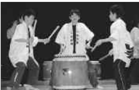
Groupe de tambours japonais qui seront présents à Cully le 1 er août 2008.

Le 24 mars 2008, la Municipalité s'envole de Genève via Frankfort pour Osaka. Le 25 mars, visite de Hiroshima et de Mizojima, puis du Château de Himegi. Le 27 mars, visite de la ville de Nara, et dès le 28 mars celle de Kyoto et ses nombreux temples. Le 30 mars, visite de Nikko, station touristique à 1300 mètres d'altitude avec, le 31 mars au matin, de la neige de printemps. Puis en route pour Tokyo. Le 2 avril, visite de Nagara Furusato Mura proche de Schiba. Retour à Tokyo via l'Ambassade de Suisse avant le retour au pays le 5 avril.