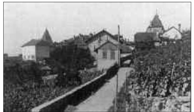
La rue St-Georges en 1915.