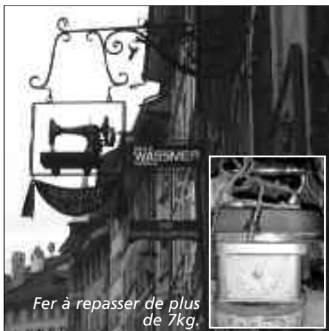
Fer à repasser de plus de 7kg.

Pour marquer la fin de la saison, les organisatrices du programme du Cep d'Or 2007-2008 ont concocté une sortie inédite le 21 mai dernier. En effet, les 29 participants de cette course ont apprécié la conduite toute en souplesse de «G.G.» chauffeur de la maison Blaser, qui les a