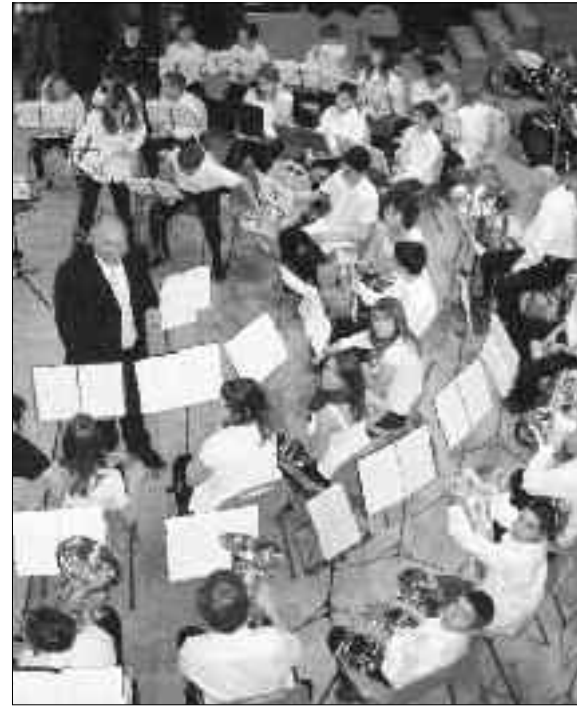
L'orchestre des jeunes sous la direction d'Olivier Cassard.

toutes les salles communales à disposition, ainsi que l'Association des Amis de Buttin-de-Loès pour ses propres locaux. Les collaborateurs du service extérieur de la commune et de conciergerie sont également