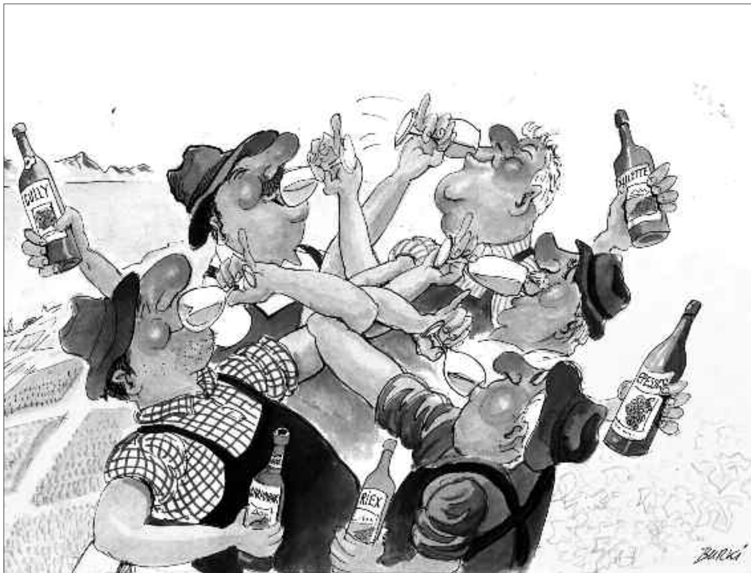
Dessin généreusement mis à disposition par M. Burki (24 Heures).

Juin fait pousser le lin et juillet le rend fin