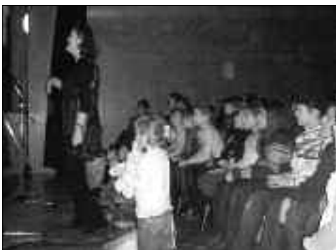
Un jeune public attentif