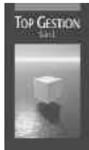
La clé du succès

La comptabilité et l'administration générale des petites et moyennes entreprises sont nos domaines de compétences faites-nous confiance !