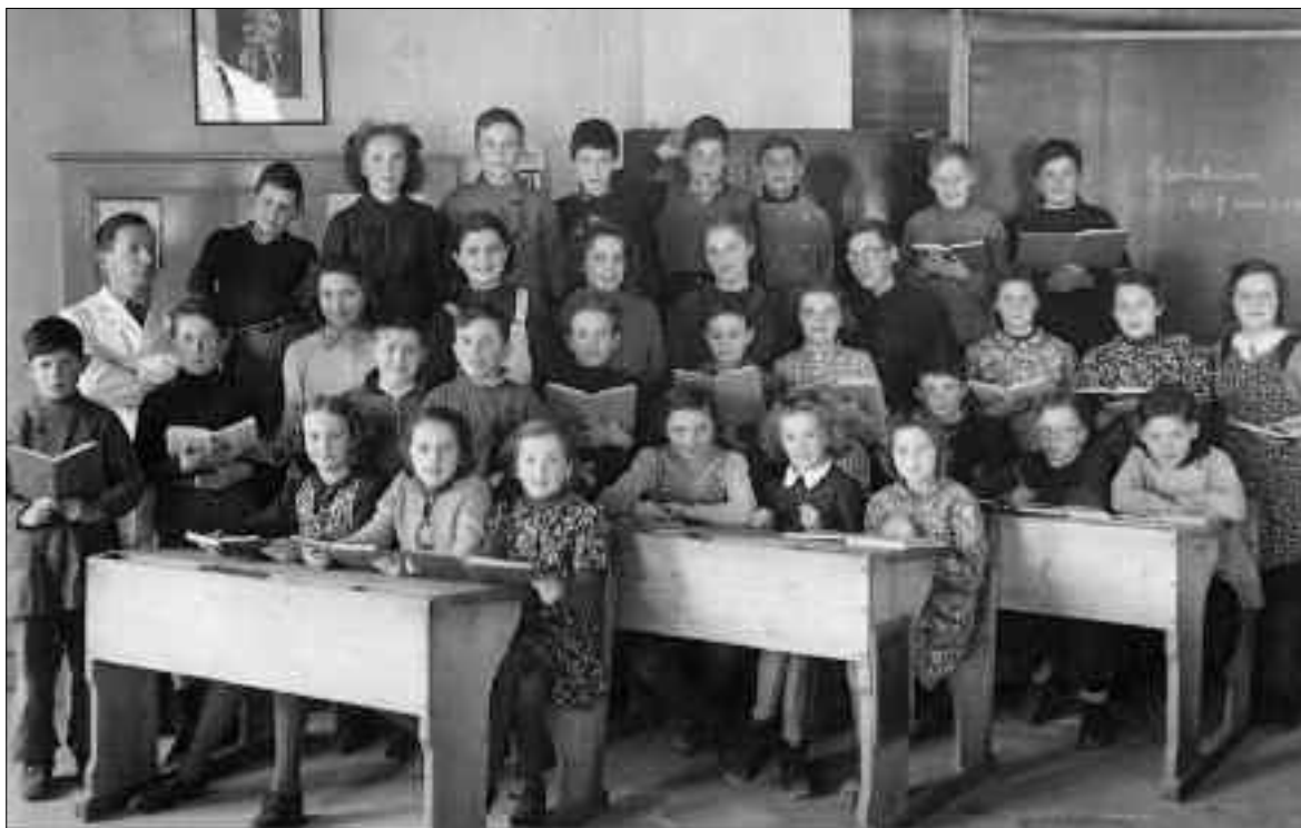
«Classe primaire mixte de Grandvaux le 9 mars 1944, située dans l'ancien Hôtel du Monde devenu Logis du Monde, tirée de l'ouvrage «Grandvaux à la recherche de son passé».

Voici les intéressantes remarques, concernant Grandvaux, contenues dans le «Rapport sur l'état des écoles» de 1844 (archives cantonales, KXIII, 147/2):