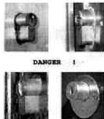
Votre cylindre ressemble-t-il à l'un de ceux-ci ?

Toutes informations utiles et contacts sur le site de la Police cantonale: www.police.vd.ch/prévention