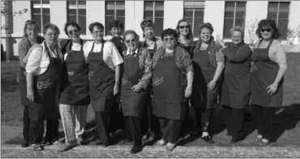
Avril 2011 – Visite et atelier de chocolat chez Cailler à Broc pour le bonheur de ces dames...

Notre prochaine assemblée de printemps a lieu le lundi 9 mai 2011, à 19h30, à la salle boisée du Collège du Genevrey, à Grandvaux.